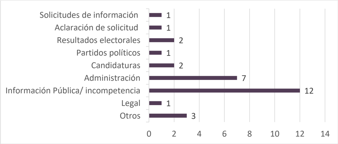
Estadística por tema

Ahora bien, resulta necesario señalar que las solicitudes de información consisten principalmente en temas relacionados con administración, información pública, entre otros.