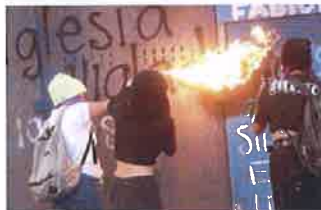
Las mujeres marcharon reafirmando este 25-N su hartazgo ante la violencia en el país y la nula acción de las autoridades.

del Antiguo Palacio de Gobierno, que no están blindado.