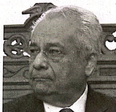
GARCÍA VILLA. Va por México, freno a la 4T

El PRI ganó por una diferencia de 2.5 puntos porcentuales, equivalentes a 30 mil